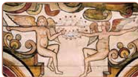
Gravide engle på træudskæring fra Saint Mary's Church i London, o. 1636

I Gotikken (ca. 1200-1500) blev portrættingen af engle præget af tiggermunkenes idealer. Englene blev mindre magtfulde og prangende. I stedet lagde man vægt på at fremstille englene mere ydmyge, fromme, rene og kyske. Faktisk mistede englene op gennem gotikken deres maskulinitet og blev ofte fremstillet som kønsløse væsner. Tabet af englenes maskulinitet førte til, at kvindelige engle gjorde deres indtog i kirkekunsten fra 1400-tallet.