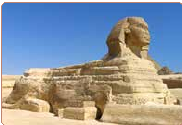
Sfinksen i Giza - ca. 2.700 f.Kr

De ældste mellemvæsner, man kender til, kender de fleste i dag uden at forbinde dem med engle, men de har haft stor betydning for forestillingen om engle i Det Gamle Testamente. Det drejer sig om den ægyptiske sfinks, som senere prægede både den babylonske og den assyriske religion og siden jødedommen og den græske mytologi.