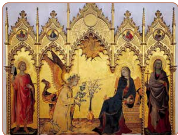
Bebudelsen fra altertavle i Siena af Simone Martini, o. år 1300

Som konsekvens af denne indsats blev alle engle fra omkring år 800 stort set gengivet på samme måde: en magtfuld mandsskikkelse med skinnende glorie og vinger. Englen var enten klædt i løse hvide klæder eller bar en rustning.