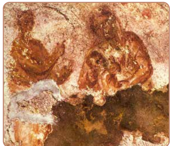
Bebudelsen fra Priscillas grav i Rom - ca. 250 e.Kr.

I øvrigt er det ældste bevarede kristne maleri af en engel fra samme periode. Det forestiller sandsynligvis Bebudelsen, hvor Gabriel fortæller Maria, at hun skal føde Jesus. Gabriel er uden vinger, men en glorie anes.