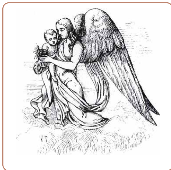
En illustration af Vilhelm Pedersen til H.C. Andersens eventyr Engelen, 1905

Gud, og de døde viste sig som engle for de levende. Især sidstnævnte var en nytolkning af engle.