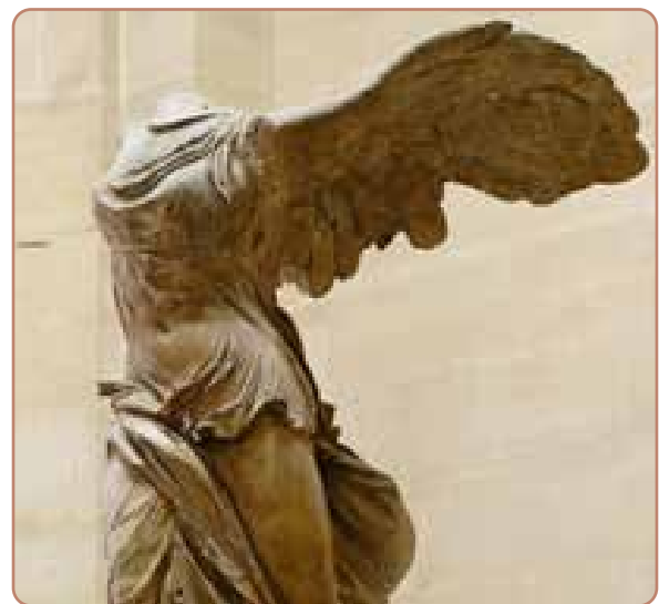
Den hovedløse statue af Niké fra øen Samothrake - ca. 200 f.Kr.

Niké var den græske gudinde for sejr (ordet Niké betyder sejr). Af samme årsag har det kendte skomærke fået sit navn. Niké var personificeringen af kamp, kraft og styrke - tre egenskaber, som også blev kendetegnende for især kampengle. Men Nikés største indflydelse på forestillingen om engle var måske hendes udseende - et kraftfuldt bevinget menneske.