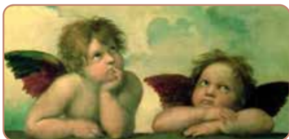
Rafaels putti fra Det Sixtinske Kapel, år 1513-14

Mest kendt af alle putti er nok Rafaels i Det Sixtinske Kapel.